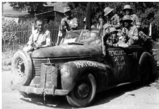
Revolutionsgarden und Partisanen, unbekannter Ort

1./ Eine Sturmtruppe /Zug/, eine mysteriöse Einheit, gekleidet in die Militäruniformen der Auslandsarmee, dessen Anführer ständig seinen Dienstgrad änderte. Die Einheit verfügte über drei kleine Tanks und bestand aus