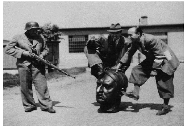
Revolutionsgardisten in Laun

Hájek schätzt die Zahl der Personen, die in Massengräbern begraben sind, auf ungefähr 2.500, außer denen, die in einigen Teilgräbern liegen. Im Übrigen führte Hájek