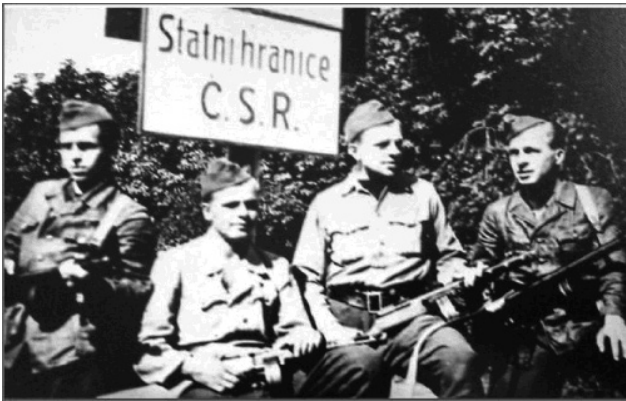
Soldaten des 1. Tschechoslowakischen Armeekorps an der Staatsgrenze

ten befürchteten, sei es aus den Behörden oder aus der Volksvertretung ( lidovládňých ), dann weiter – und darin muss man wohl den wahren Grund erblicken – wegen der übermäßigen Politisierung aller Behördenapparate, die sich daher nur den Parteien zu dienen bemühen und darüber Vergessen, dass es besonders ihre Aufgabe ist, dem Staat und Vaterland zu dienen.