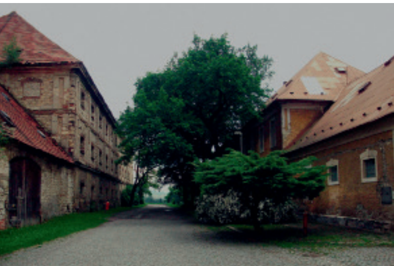
Postelberg, alte Reiterkaserne heute

Da warteten wir, bis die nächste Kolonne anmarschierte, und wir sind dann in Sechserreihen unter Bewachung von berittenen Soldaten nach Postelberg geführt worden und kamen dort erst am Nachmittag an. Die Stadt machte für mich einen geisterhaften Eindruck, sie war völlig leer, es war kein Mensch auf der Straße, und wir wurden dann