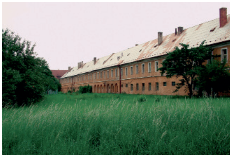
Postelberg, alte Reiterkaserne heute

In der Nacht zum Donnerstag wurde auch die antifaschistische Gruppe in die Kaserne gepfercht, vermutlich damit wir nicht Zeugen der Hinrichtungen wurden. Wir waren froh drüber, weil wir uns sagten, wenn man uns sozusagen aus dem Geschehen heraushält und uns nicht zu Mitwissern macht, werden wir überleben. Das war unser Gedanke. Ich wurde dann in einen Raum gepfercht, der schon voller Menschen war und keine Luftzufuhr hatte. Vor allem die, die herzkrank waren, bekamen Probleme. Es sind eine ganze Reihe Leute mental außer Tritt gekommen, und ein Freund von mir machte mich aufmerksam,