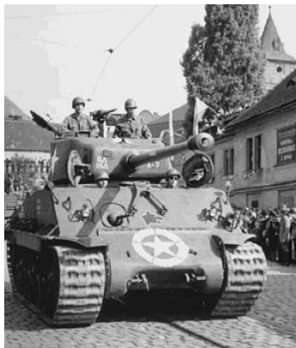
Amerikanische Panzer rollen in Pilsen ein