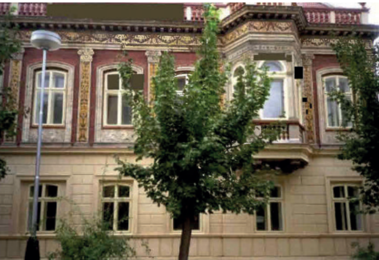
Křiž-Villa in Saaz, heute Zeyerova 344

gesagt: „Pater, wir werden Sie mit dem Auto fahren.“ Aber dann hat man ihn erschossen; es soll auf Befehl des eigentlichen Schuldigen, des Herrn Zicha, geschehen sein.