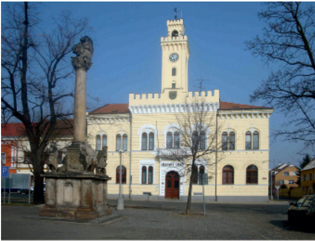
Das Postelberger Rathaus mit renovierter Fassade