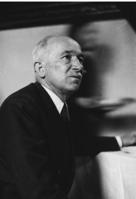
Präsident Edvard Beneš setzt auf Sozialismus und den „großen slawischen Bruder“

tung der Tschechoslowakei eigene Vorstellungen. Diese wurden schon teilweise im Regierungsprogramm von Kaschau (Košice) im April 1945 („Kaschauer Programm“) durchgesetzt. Die Bildung einer „Nationalfront“ 4 , vorbereitende Maßnahmen zur Verstaatlichung der ganzen Schlüsselindustrie, insbesondere auch die Gebietsreform und weitere Schritte waren schon Wegweiser zu einer Gesellschaft nach sowjetischem Muster. Die Visionen des bürgerlichen Exilpräsidenten Edvard Beneš von einem „Nationalen demokratischen Sozialismus“ mit Hilfe des großen slawischen Bruders waren eine Brücke, über welche die Kommunisten gut gehen konnten. In die-