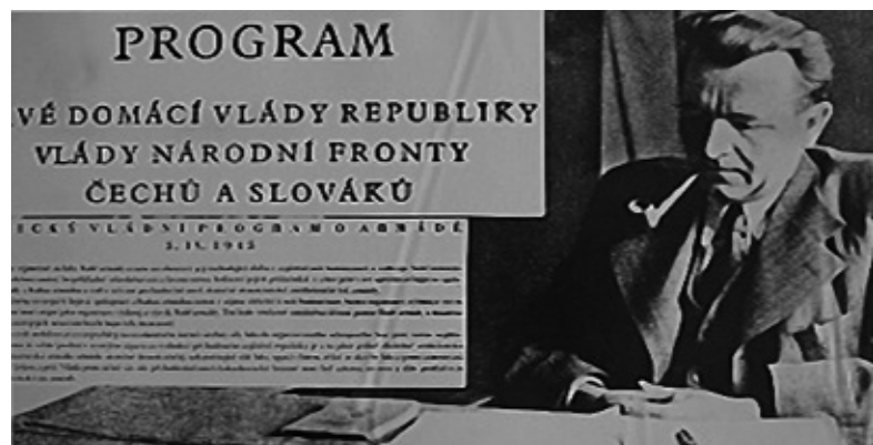
KP-Chef Klement Gottwald wirbt für das Kaschauer Programm, das die kommunistische Herrschaft vorbereitet

Die Koordinierung der Aktionen der Roten Armee (RA), der Tschechoslowakischen Volksarmee (ČSLA) und der sogenannten Revolutionsgarden (RG) mit der politischen Unterstützung durch die Kommunisten während der Säuberungsaktion in Postelberg, Saaz und Umgebung erweist sich als beispielhaft [für entsprechende Aktionen an anderen Orten]. Die Stadt Postelberg wurde von Einheiten der Roten Armee schon am 9. Mai 1945 besetzt. Zusammen mit der Roten Armee kamen auch Personen tschechischer Herkunft, die das Rathaus besetzten. Nach der Gründung eines revolutionären Nationalausschusses