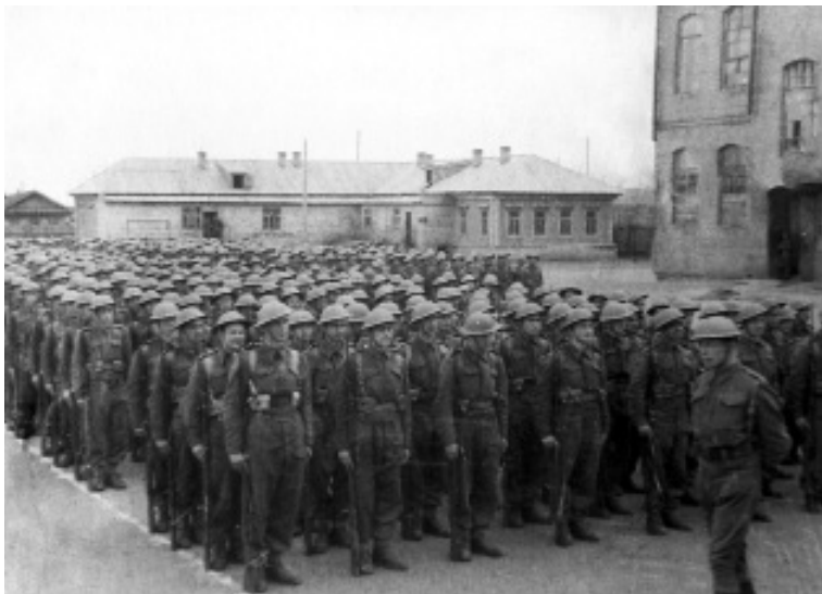
Antritt des 1. Tschechoslowakischen Armeekorps in Buzuluk

Die Wurzel des Übels war die Kommunistische Partei der Tschechoslowakei (KPČ). Sie ist 1921 aus der Linksfraktion der Sozialdemokratischen Partei entstanden.