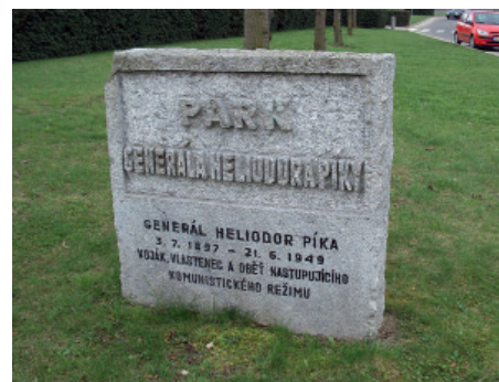
Grabstein von General Heliodor Píka in Böhmisch-Leipa (Česká Lípa)

General Píka 3 war gut darüber informiert gewesen, wie es in der Sowjetunion und in der Sowjetarmee tatsächlich zugeht. Píka hat auch eine ganze Reihe von Fakten gekannt, die die Sowjets nach dem Ausbruch des Kalten Krieges vor den Amerikanern geheim halten wollten. In den frühen Morgenstunden des 21. Juli 1949 wurde General Heliodor Píka hingerichtet. In der Nacht vor seiner Hinrichtung schrieb er an seine Familie, er sei überzeugt, es handle sich nicht um einen Justizirrtum, sondern um politischen Mord. 1968 wurde Píka in vollem Umfang rehabilitiert.