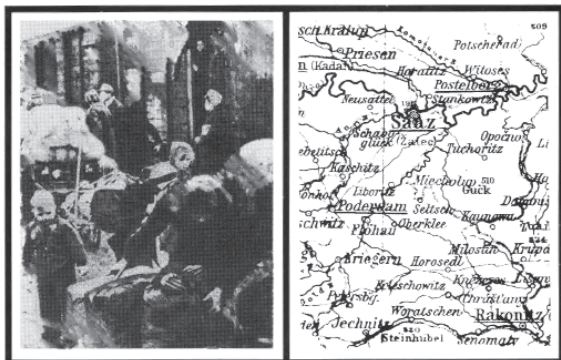
Eine Dokumentation zusammengestellt von Erich Hentschel, 1995