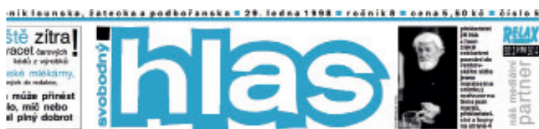
Die Launer Wochenzeitung Svobodný Hlas („Freie Stimme“)