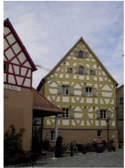
Das Markgrafenschlösslein in Georgensgmünd, in dem die „Saazer Stube“ untergebracht ist