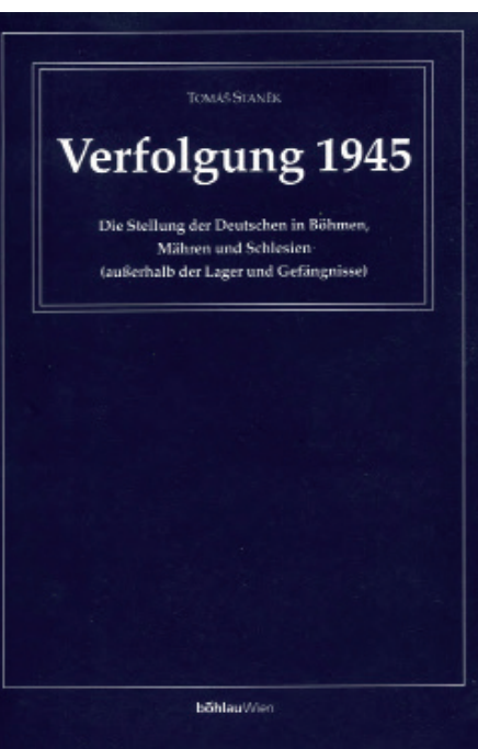
Die deutsche Ausgabe von Tomáš Staněk, Perzekuce 1945 , Prag 1996, erschien erst 2002.