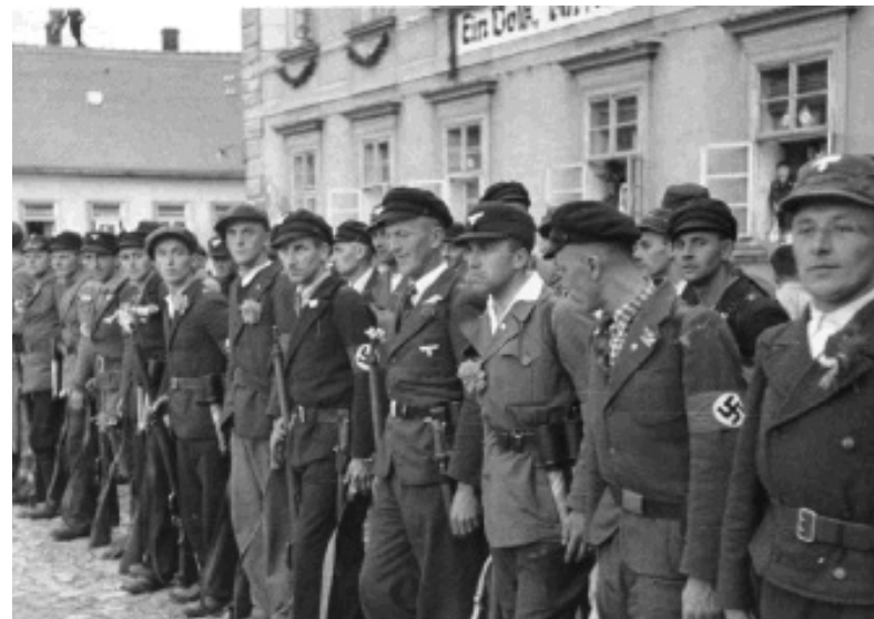
Terror war Hitler und Henlein ein Mittel, ihre nationalistischen Ziele zu erreichen: Eine Abteilung des „Sudetendeutschen Freikorps“ tritt am 10. Oktober 1938 in Niemes an, die Deutsche Wehrmacht zu begrüßen

war keineswegs ein „Ausdruck des spontanen Volkszorns“, wie Goebbels glauben machen wollte, und endete in Saaz verhältnismäßig glimpflich 27 . Noch verwirrender auf nachdenklichere Gemüter wirkte dann im März 1939 der von Schnee und Eis begleitete Marsch der deutschen Wehrmacht auf Prag 28 . Er irritierte das Rechtsgefühl vieler Saazer nachdrücklich, denn man hatte gerade müh-