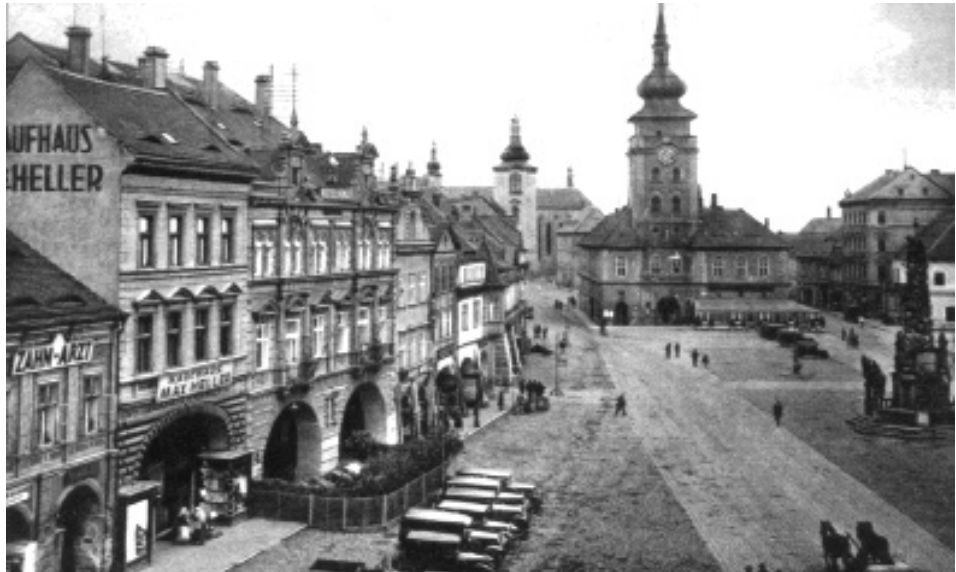
Saaz, Ringplatz: Hier mussten sich am 3. Juni 1945 Männer und Kinder ab 14 Jahren zum Abmarsch nach Postelberg versammeln

Montag, 4. Juni: Nach einer Nacht auf dem Pflaster der alten Postelberger Kavalleriekaserne wurde am Morgen plötzlich unmotiviert auf uns geschossen. Es gab Tote und Verwundete 34 . Unter Todesandrohung mussten alle die Taschen ausleeren und ihre Wertsachen abliefern, bei der anschließenden Körpervisitation wurde alle sonstige Habe vernichtet, auch Medikamente. Gegen Mittag kamen Lastwagen. Sie holten Ärzte, Apotheker, Beschäftigte der Saazer Versorgungsbetriebe und Vertreter an-