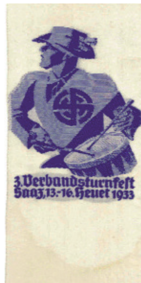
Ansteckwimpel der Teilnehmer am Verbandsturnfest in Saaz 1933

Es gab damals, so viel ist sicher, kaum ideologisch geprägte Nazis in Stadt und Land, aber 1938 viele Sympathisanten des „Anschlusses“ 19 . Darunter waren viele Menschen, die vor dem Ruin standen und deren wirtschaftliche Existenz durch das Ende der tschechischen Repression gerettet wurde.