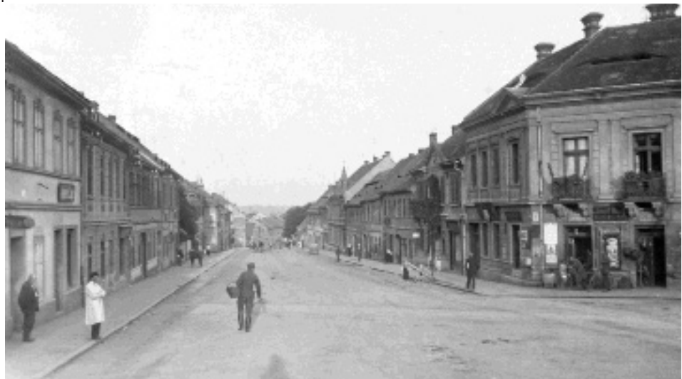
Postelberg, Bahnhofstraße um 1940