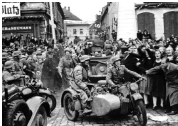
Freudige Begrüßung der Wehrmacht beim Einmarsch in Saaz 1938