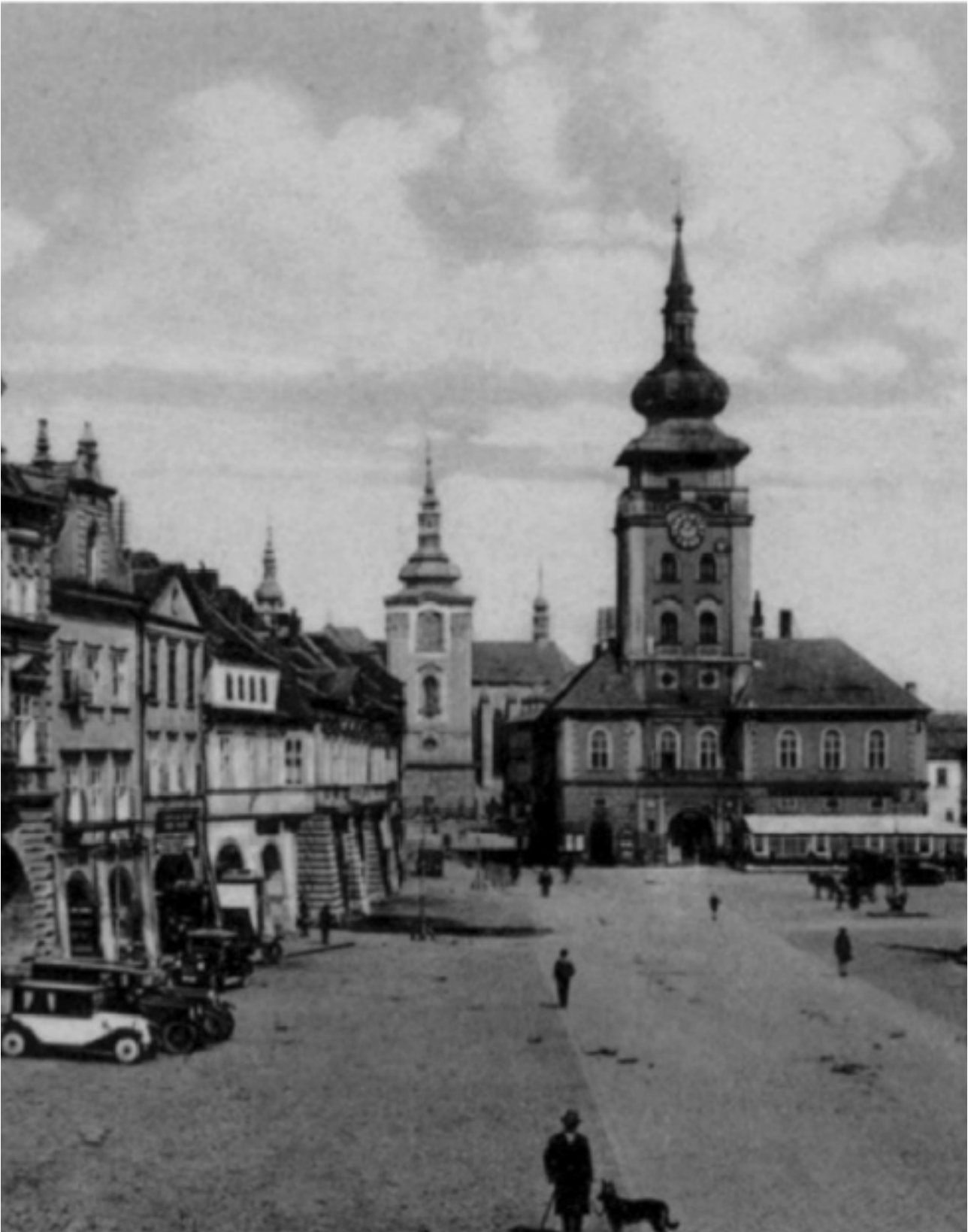
Saaz, Ringplatz vor 1945