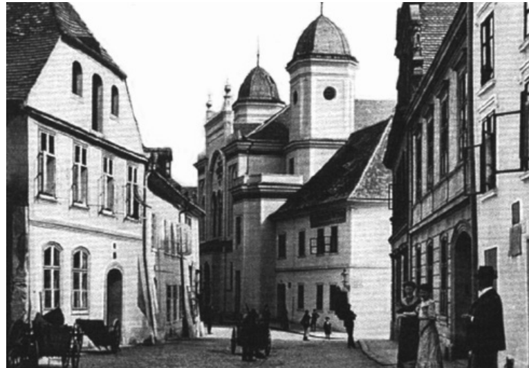
Saazer Synagoge 1910

D ie Saazer waren auf das, was kommen sollte, nicht vorbereitet. Gewiss sahen im Frühjahr 1945 viele Menschen hier dem Wandel der Dinge mit Bangen, aber nicht mit Verzweiflung entgegen. Den Sudetendeutschen wurde später vorgeworfen, 1938 die Republik verraten zu haben; dafür seien Enteignung und Vertreibung nur gerecht. Die Deutschböhmen erwarteten dies jedoch nicht. Hatten die Tschechen 1918 nicht selbst aus nationalen Gründen Verrat an ihrem Staat, der Österreich-Ungarischen Monarchie gegangen? Wieso sollten also jetzt die Deutschen dafür bestraft werden, dass sie ihrerseits