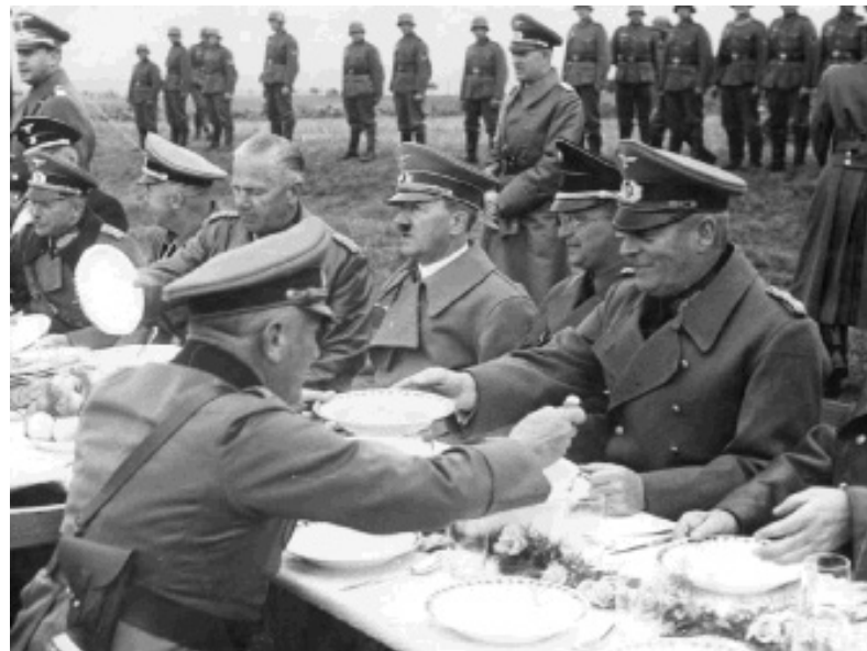
Konrad Henlein neben Hitler kurz nach dem „Anschluss“, zweiter von rechts. Wenig später wurde er von Hitler zum ihm direkt unterstellten „Reichskommissar für die sudetendeutschen Gebiete“ mit Sitz in Reichenberg ernannt

Für uns Deutsche endete der kurze Rausch der Freiheit exakt vier Wochen nach dem Einmarsch der Wehrmacht mit dem Judenpogrom vom 9. November 1938, vulgo „Reichskristallnacht“. Sie wurde von außen angeordnet,