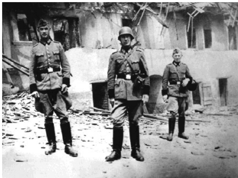
Deutsche Soldaten im zerstörten Lidice

Das Verbandsturnfest 1933 als große nationaldeutsche Veranstaltung in Saaz war wohl kaum in das Bewusstsein der zum Teil landfremden Soldaten gedrungen, spielte aber in möglichen Weisungen aus Prag vielleicht eine Rolle 62 . Glaubhafter ist, dass sich hier die Ranküne der im Herbst 1944 am Dukla-Pass noch einmal empfindlich geschlagenen Kommandeure 63 ausgetobt hat, und sicher wirkte wohl auch das Beispiel vieler sowjetischer Truppenteile nach. Aber aus den vorliegenden Papieren