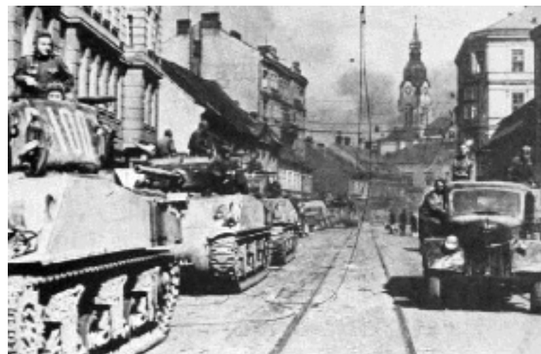
Russische Panzer rollen am 2. Mai 1945 durch Brünn

Am 1. Juni füllte sich die Stadt plötzlich mit tschechischen Uniformen 31 , und unter der Hand zirkulierten