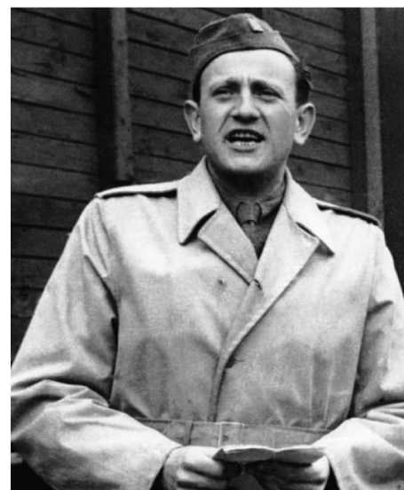
Oberstleutnant Bedřich Reicin als OBZ-Kommandant

ZÍCHA: Ich sprach darüber mit Černý, und sofort danach fuhr ich nach Prag, wo wir die Sache mit [Hauptmann] Steiner durchsprachen und uns darauf einigten, dass eine solche Sache auf keinen Fall in der Zukunft [nochmals] geschehen darf.