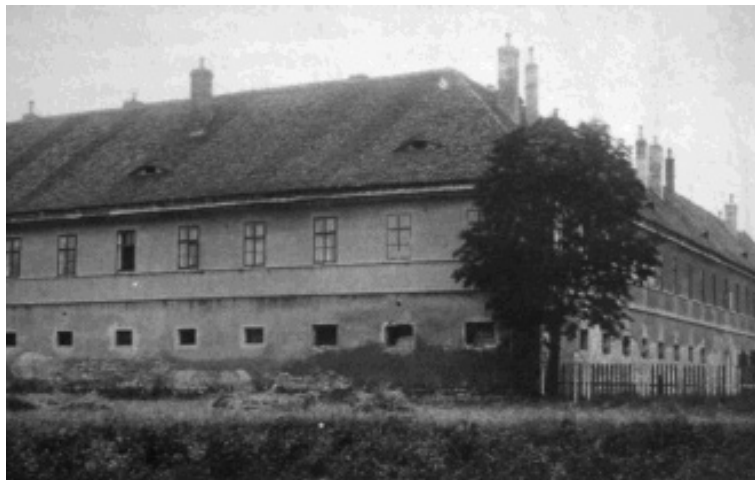
Ehemalige Reiterkaserne in Postelberg, im Mai/ Juni 1945 Internierungslager für Deutsche aus Postelberg, Saaz und Umgebung

BUNŽA: Im Verzeichnis stehen 44 Personen. Wurden sie alle hingerichtet?