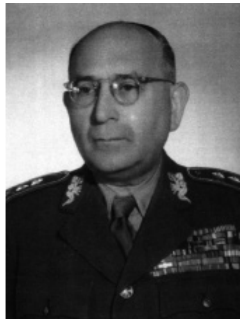
Brigadegeneral Oldřich Španiel

BUNŽA: Uns geht es darum, dass Sie uns sagen, wie die Ereignisse abgelaufen sind. Sie sprechen auf merkwürdi-