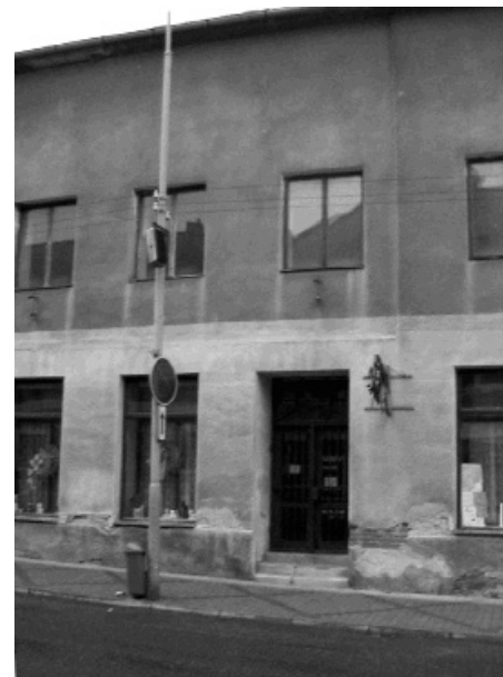
OBZ-Kommandantur in Postelberg Haus Nr. 74 gegenüber vom Gericht

Černý: Ich weiß nicht, wie das jemand auffasst. Wenn das deutsche Volk es fertigbringt, 25 Millionen Menschen umzubringen, ist es schwer, anders zu handeln [als wir], wenn wir mit ihnen Schritt halten wollen.