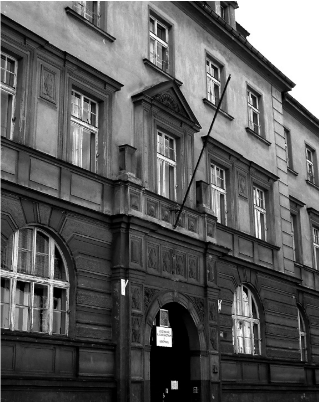
Gebäude des ehemaligen Bezirksgerichtes Saaz in der Schönfeldgasse, heute Sonderschule in der Dvořáková