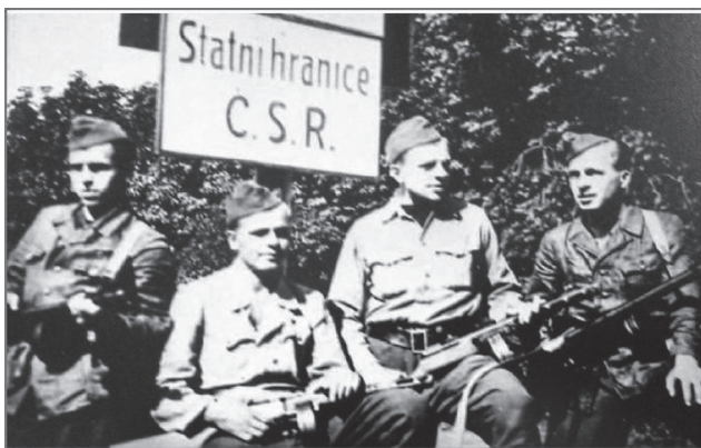
Vojáci 1. československého armádního sboru na státních hranicích

tak bylo by lze získati skutečný přehled o vině či nevině na věci zúčastněných osob.