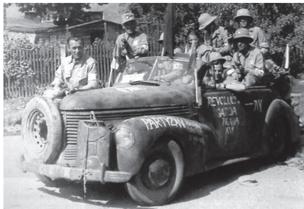
Revoluční garda a partyzáni