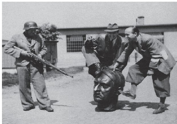
Revoluční gardy v Lounech